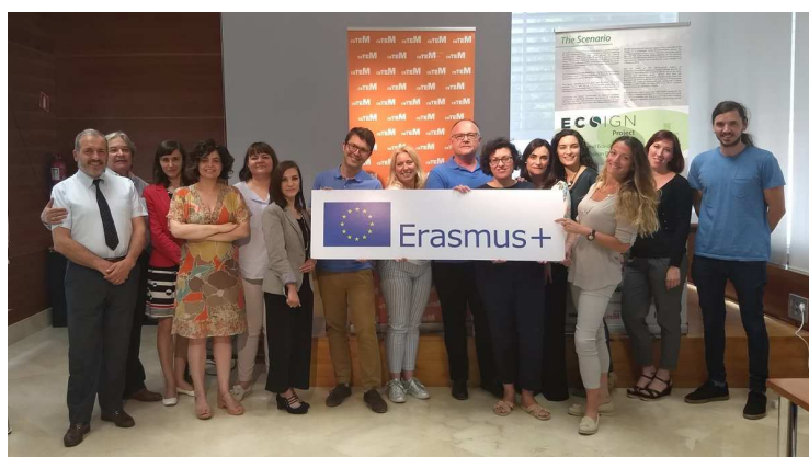
Figura 2: Riunione di Yecla

L'ultima riunione del Consorzio si è tenuta a Yecla (Spagna) presso il CETEM (Centro di ricerca e formazione per il settore del mobile e legno della Regione di Murcia) il 23-24 Maggio 2018. Il principale obiettivo è stato quello di valutare i primi risultati dei corsi pilota realizzati dai partner nei diversi settori dell'imballaggio alimentare, dell'elettronica e del tessile .